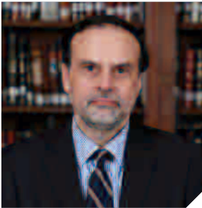
ENRIQUE NAVARRO BELTRÁN

Director del programa Ex Ministro del Tribunal Constitucional