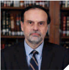
ENRIQUE NAVARRO BELTRÁN

Director del programa Ex Ministro del Tribunal Constitucional